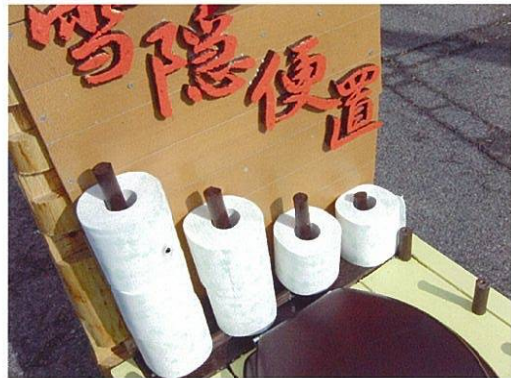
トイレットホルダーも付いてます！