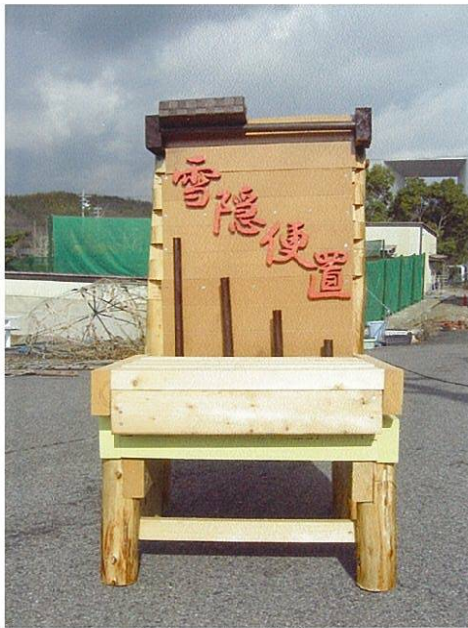
普段は普通のイス