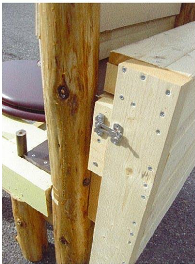
外した座面は後ろに固定