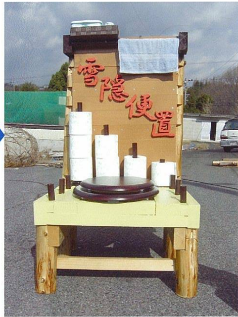
しかし大災害時にご覧のトイレ 「雪隠便置」に早変わり！！