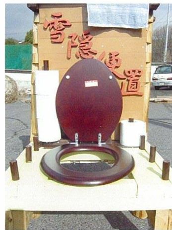
便座を上げたところ