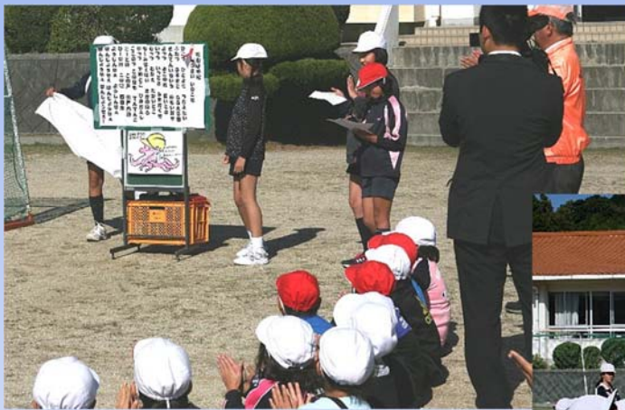
11月5日津波防災の日に 唄の除幕と発表会