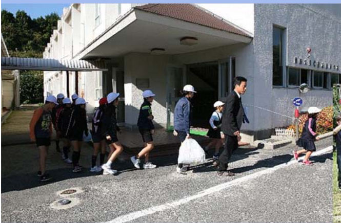
備蓄レインコートを持ち避難