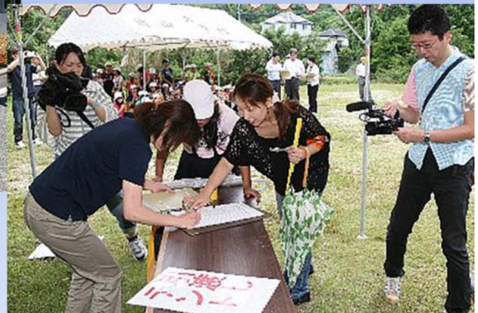
保護者参加で初の引渡し訓練