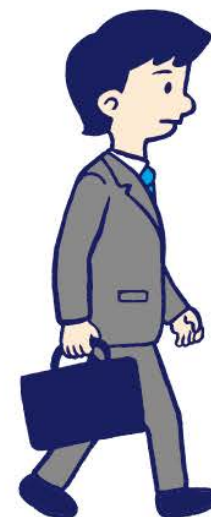
じ そく ⑤歩き(時速 4km)