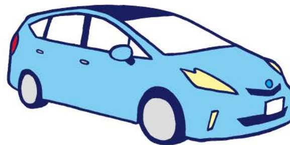
じ どう しゃ じ そく ②自動車(時速 80km)