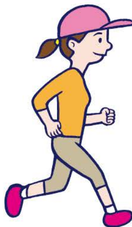
じ そく ④ジョギング(時速 10km)