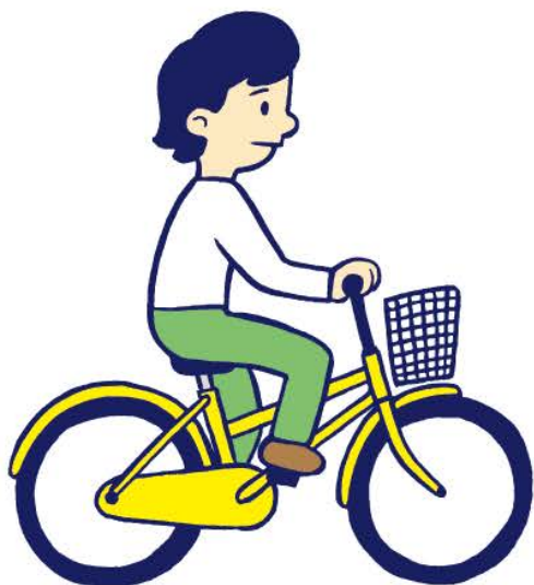
じ てん しゃ じ そく ③自転車(時速 25km)