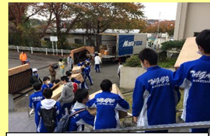
多賀城市総合防災訓練