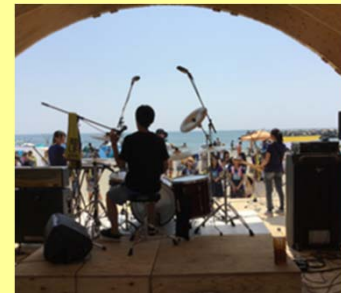
七ヶ浜海開きフェス