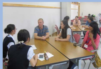
被災地案内国際ボランティア