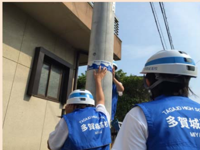
津波波高標識設置