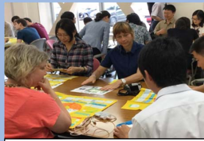
環太平洋大学協会