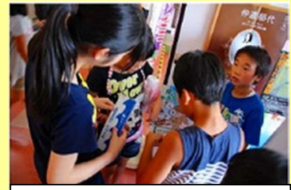
地区防災キャンプ