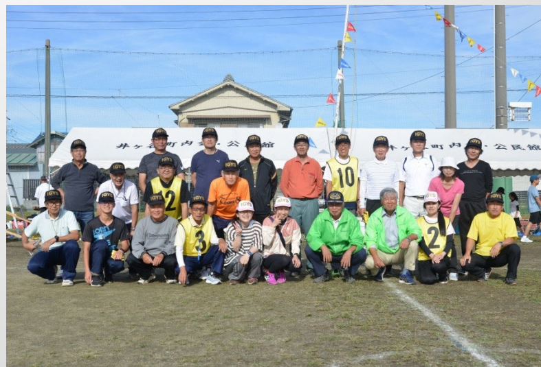
町内会の有志の団体「体育部」