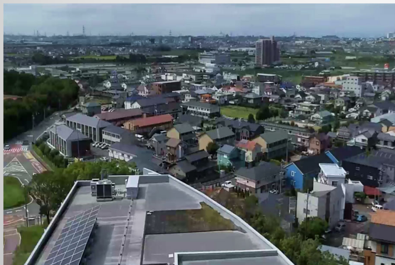
大学キャンパスからみる井ヶ谷町

第 40 回町内運動会 人口約 6000 人 昼間人口+ 5000 人(最大数)