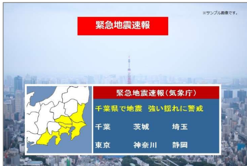
テレビなどでの緊急地震速報